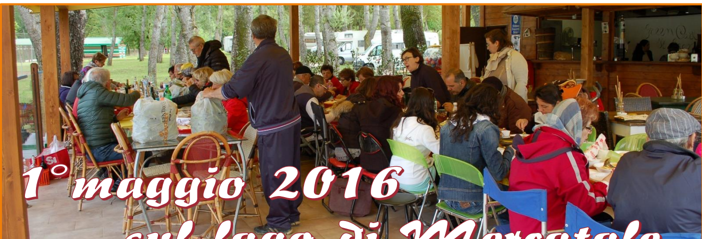
1° maggio 2016 sul lago di Mercatale