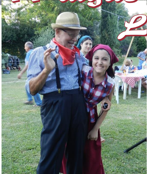
La festa contadina