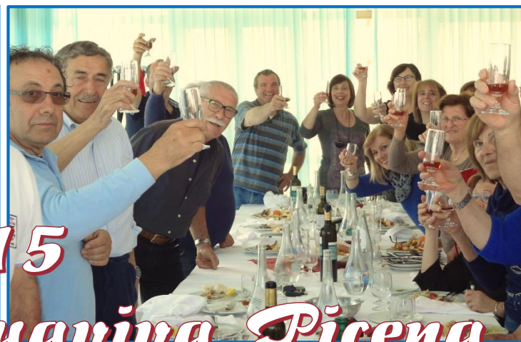
1° maggio 2015 ad Acquaviva Picena