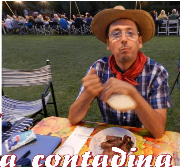
11 luglio 2015